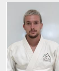
BPJEPS Judo 2 ème DAN